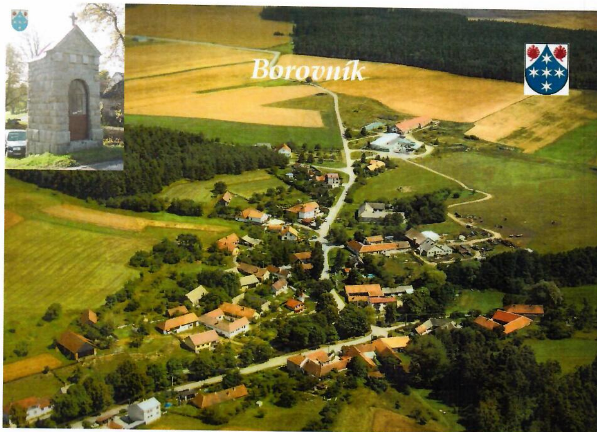
Obrázek 1 Letecký pohled na obec Borovník

Celková katastrální plocha obce činí 272 ha.. Z celkové katastrální plochy obce zabírá orná půda asi 70%. Lesů a ploch s travnatým porostem je zde velmi málo.